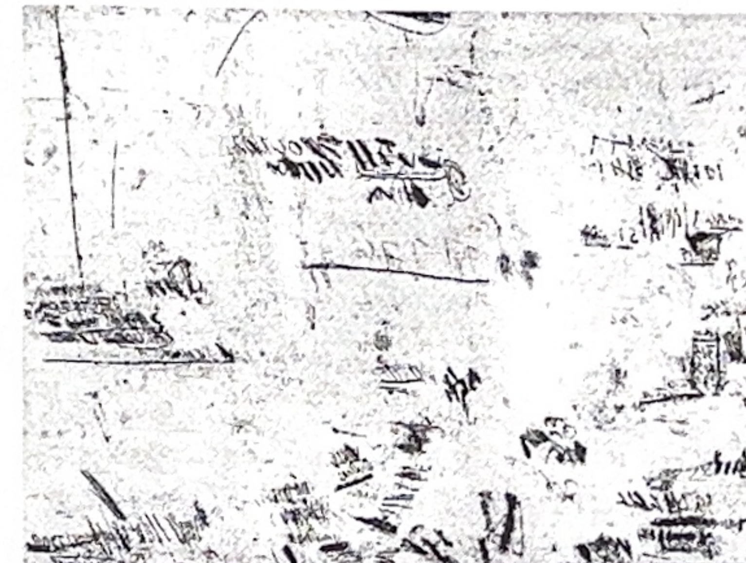
• Sylvie Canone, "2 septembre", eau-forte