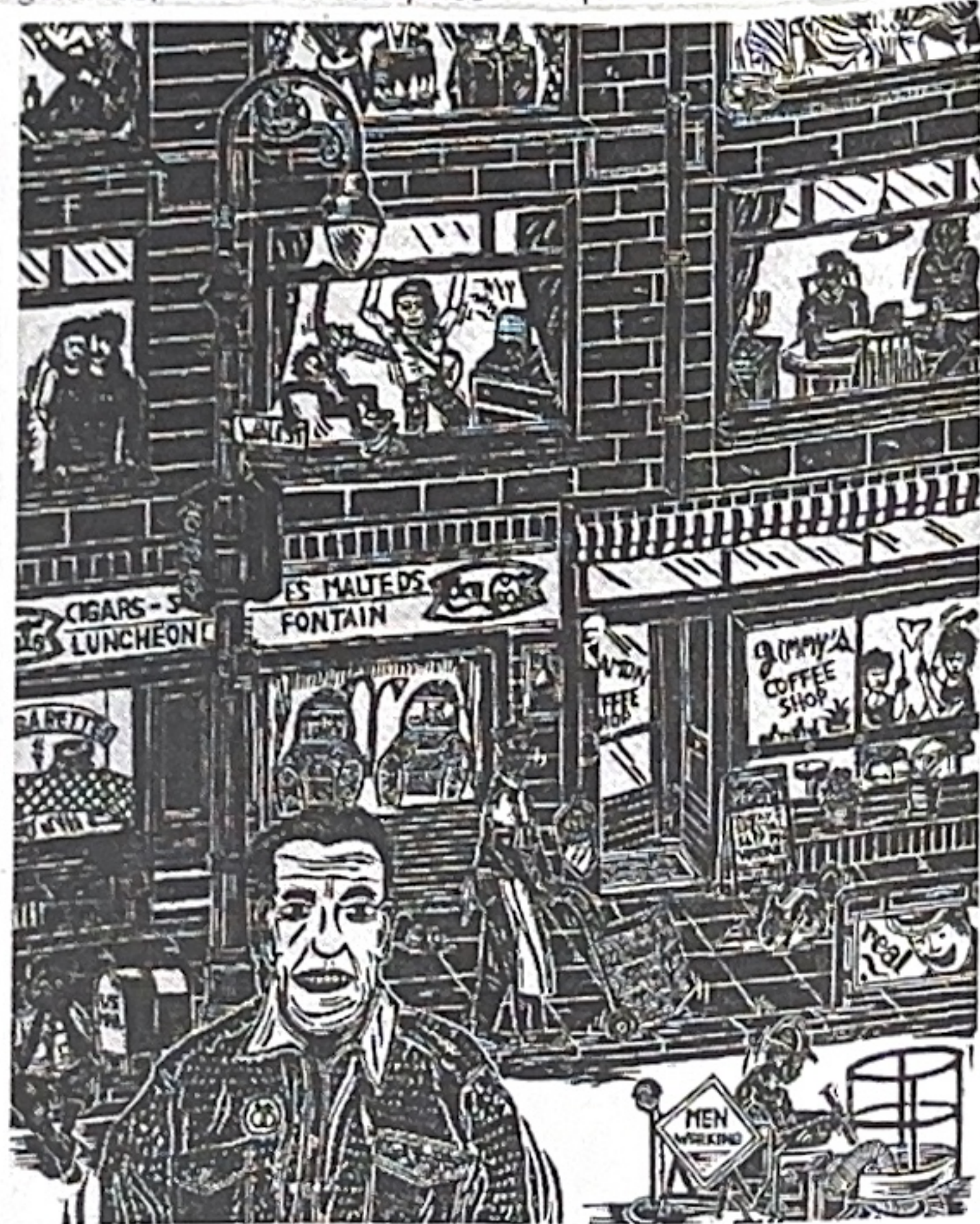
• Thierry Lenoir "Neighbours n° 3" 1990 gravure sur bois

La troisième édition du prix en 1991 gratifia Sylvie Canone (Huy, 1963), diplômée de l'École Supérieure des Arts Plastiques de Mons. Illustratrice,