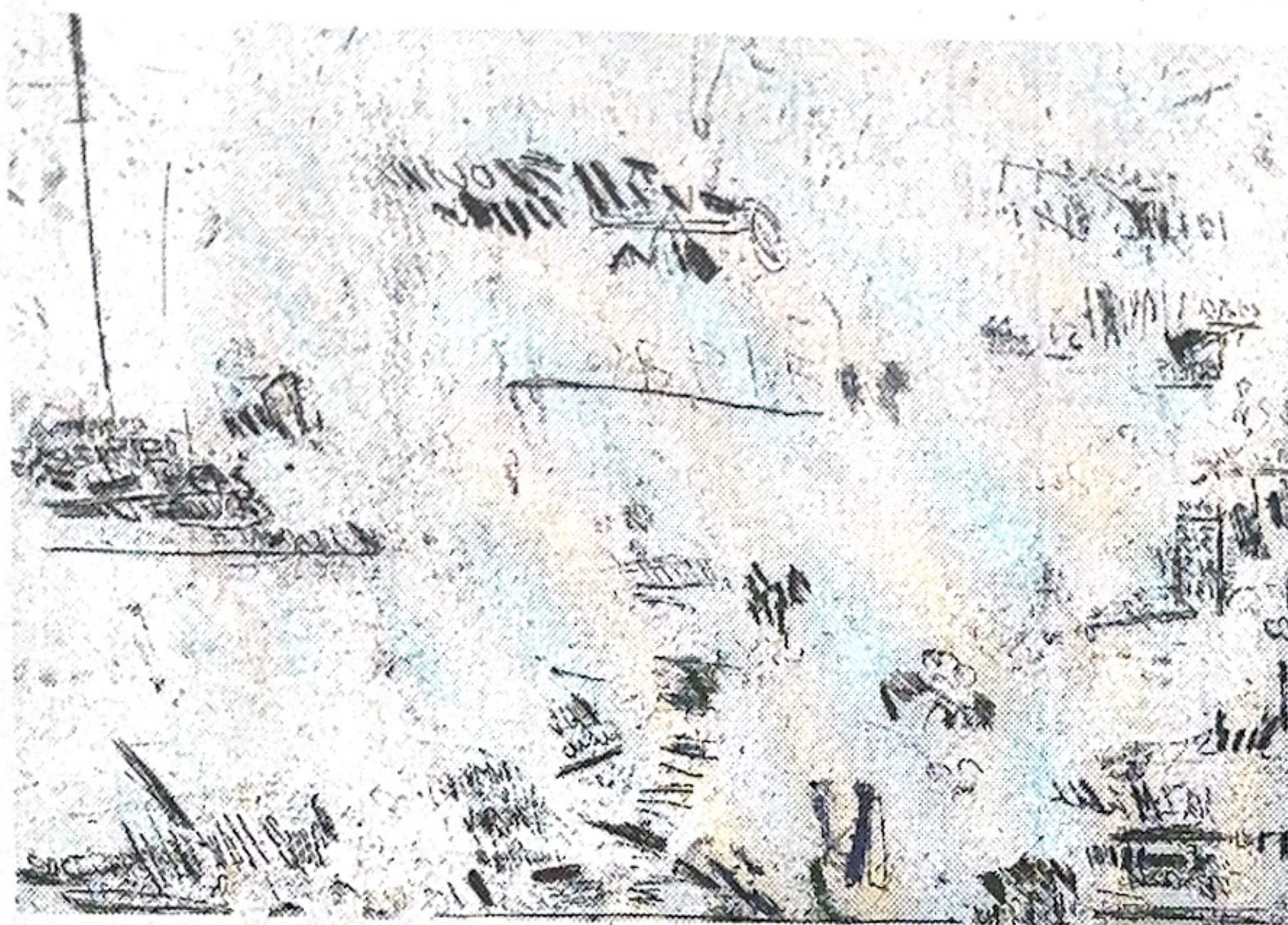
• Sylvie Canonne, eau-forte