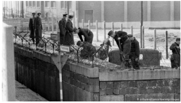
Le Mur est construit en 1961 par les autorités est-allemandes