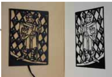
Mallette : La naissance de la gravure