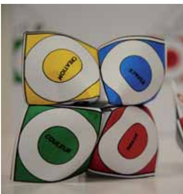
Mallette : Clés pour l'art contemporain