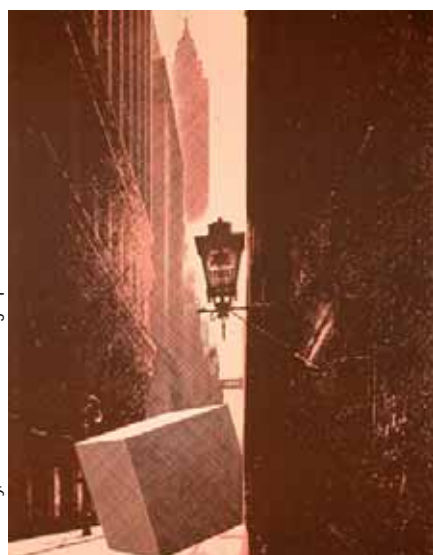
Pol Bury, Pine Street - Lithographie - 1971