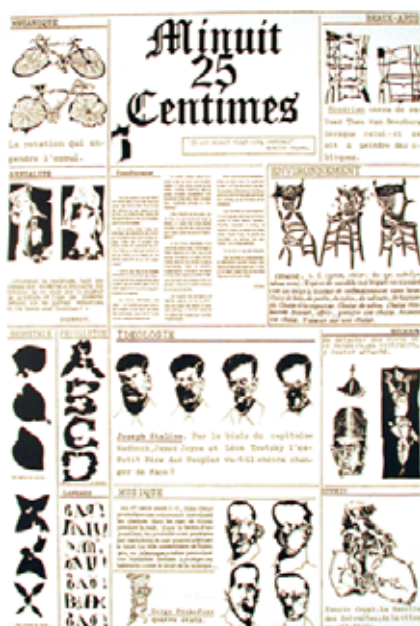
Pol Bury et Achille Chavée. Il est minuit 25 centimes - 1974