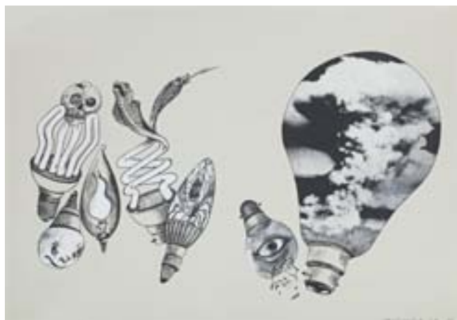
© Daniel Nadaud, Le climat devient incroyablement électrique, 2012