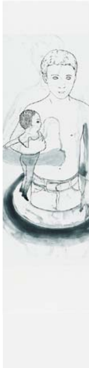
© Françoise Pérovitch, Le garçon à la poupée, taille-douce, 2013