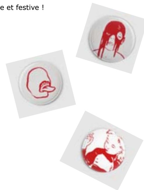
© Françoise Petrovitch, extraits de la série Rougir , badges