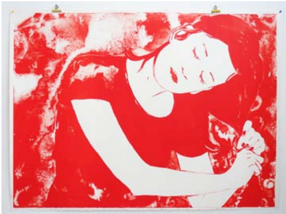
Sans titre, lithographie, 2016

L'exposition mêle estampes, sculptures, dessins muraux et une installation vidéo intitulée Le loup et le loup .