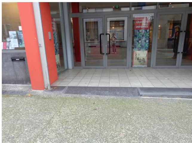
La rue des Amours

Pas de marche à l'entrée du Centre de la Gravure et de l'Image imprimée